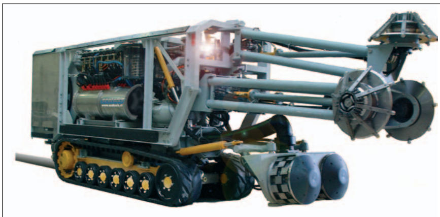
Een Remote Operated Cleaning Machine voor het schoonmaken van koelwaterbuizen van een elektriciteitscentrale in Hong Kong.

Onderwaterapparatuur kan van alles inhouden. Vaak betreft het hierbij unieke, eenmalige ontwerpen. Bij het bedrijf Seatools kijken ze nergens meer van op. Of het nu gaat om een hydraulische compensator, een vrij vliegend (onder water) inspectievoertuig of een apparaat om mossel-aangroei van koelwaterbuizen te verwijderen.