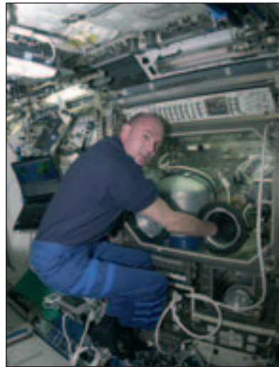
André Kuipers doet zijn experimenten in een Microgravity Science Glovebox, die door Bradford Engineering is ontworpen en gebouwd.

Bradford Engineering is een internationaal klinkende naam voor een oerhollands bedrijf. In het kleine Brabantse Heerle worden door dit specialistische bedrijf, met 75 werknemers, geavanceerde producten voor de ruimtevaart ontwikkeld, getest en geproduceerd. Het meest bekende product van Bradford Engineering is de zogenaamde Glovebox. Dit is een soort couveuse waarmee in de ruimte experimenten worden gedaan.